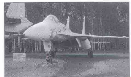
Eine Suchoi-27 in der Gagarin-Akademie.

Als Krisensymptome nannte Fedorow: die schlechte Moral und Disziplin der Truppe,