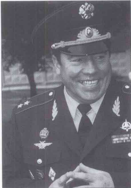
Generalleutnant Naidjanow, stellvertretender Kommandant der Luftwaffen-Akademie.

politischen Führung der Gorbatschow- und Jelzin-Jahre.