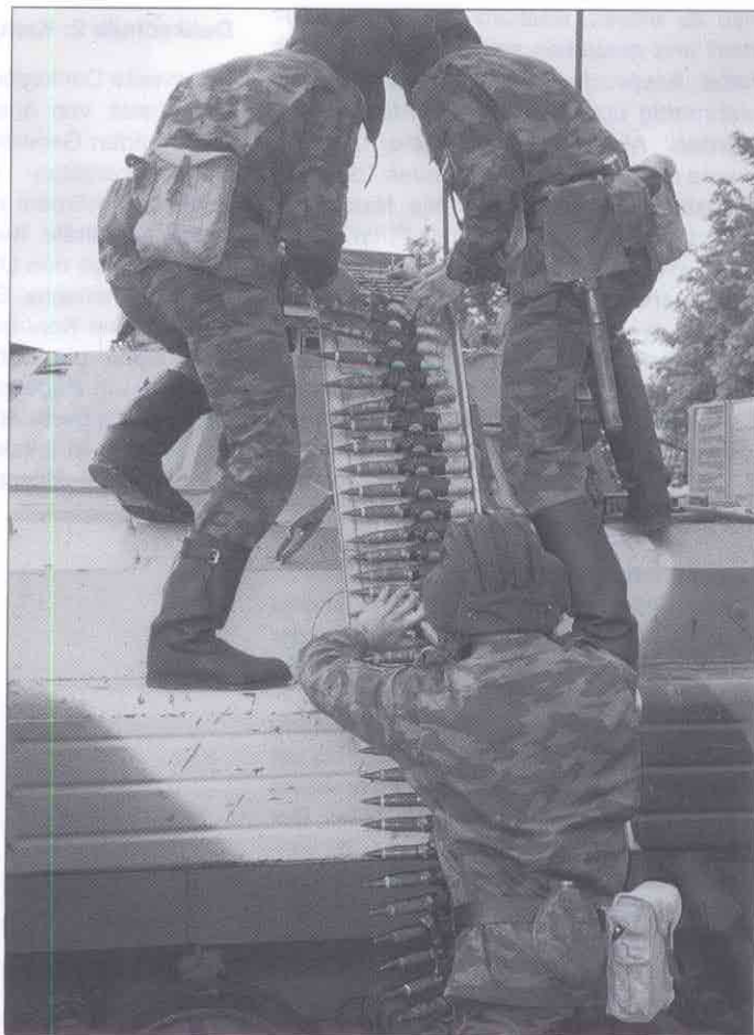
Panzergrenadiere der 27. Infanterie-Brigade.

Ein differenziertes Bild entwarf in St. Petersburg Vizeadmiral Nikita Sakurin. Er empfing die Schweizer Abordnung in den stilvollen Räumen der Kusnetsow-Marine-Akademie. In einem gehaltvollen Referat gestand Sakurin ein, die russische Flotte sehe sich gegenwärtig auf ihren Einsatz als Küstenmarine zurückgeworfen. Ihr Hauptauftrag laute, am Pazifik, im Nordmeer, an der Ostsee und im Schwarzen Meer die weitläufigen Küsten des Landes einermassen zu schützen. Auch Sakurin, seines Zeichens stellvertretender Kommandant der Marine-Akademie, übte Kritik an der