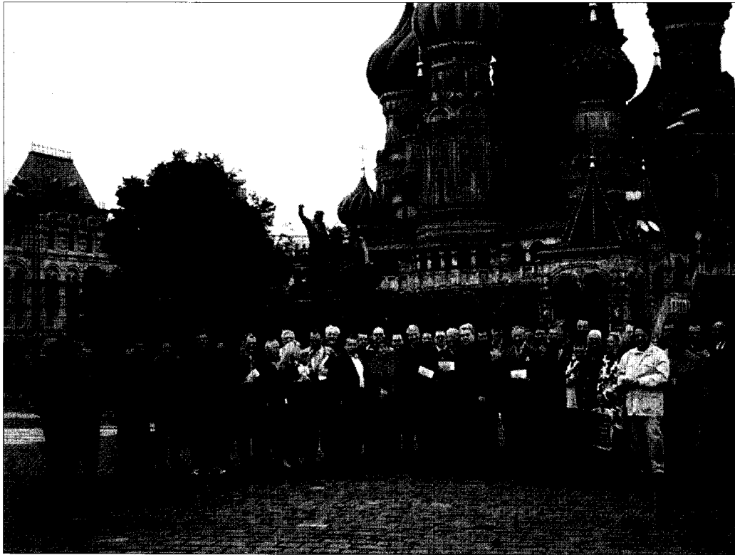
Die SOG-Reisegruppe vor der Vasily-Kathedrale auf dem Roten Platz in Moskau.